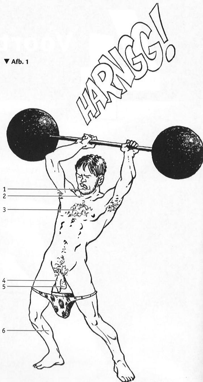
▼ Afb. 1